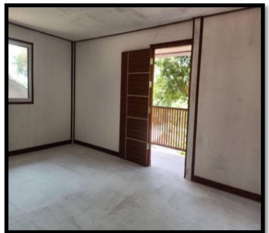
มดทีประชุม